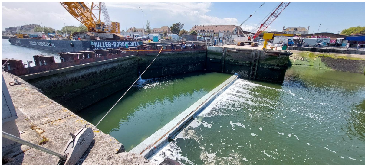
Batardeau mis en place

Ce chantier représente un investissement de 3,5 M€ , financé par :