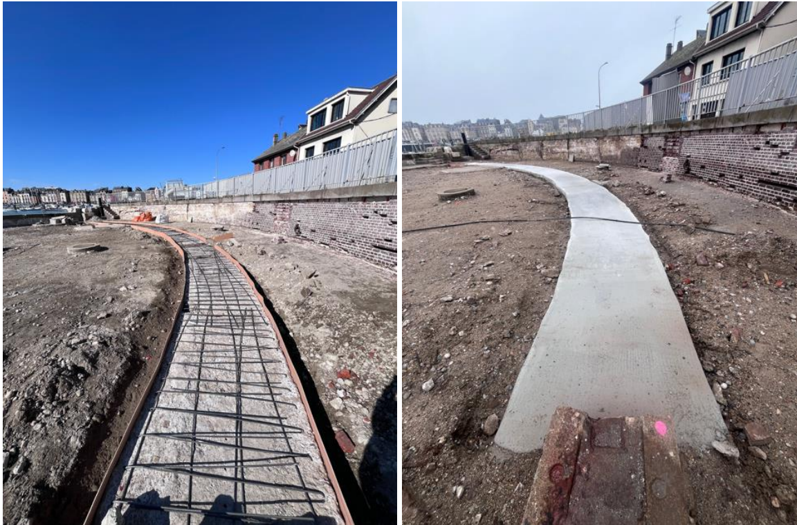
La dalle de béton sur laquelle reposera le rail de rotation du pont

Enfin, en accord avec la DRAC, un système d'évacuation des eaux est en train d'être mis en place sur cette zone afin de limiter la corrosion.