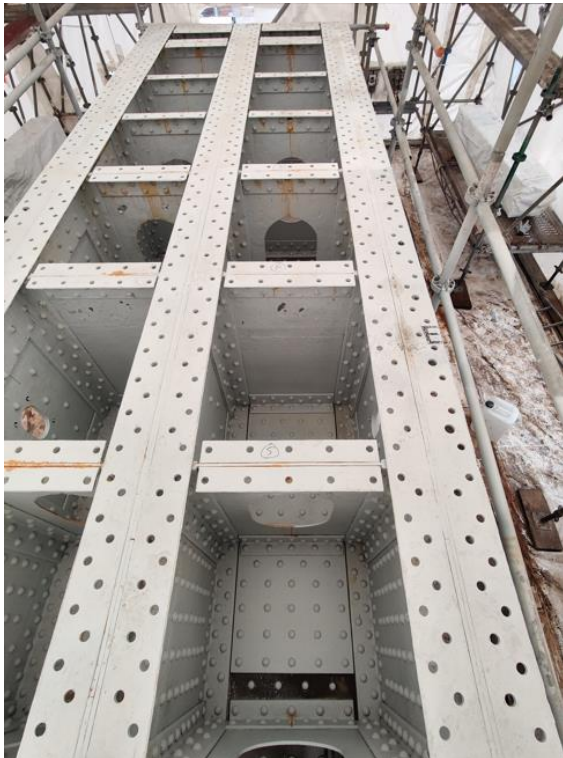
Le chevêtre après sablage

Quant au chevêtre (sorte de grosse « caisse » située sous le pont et qui répartit les charges entre le tablier et le pivot), il est en cours de sablage, remise en peinture et remplacement des rivets et autres éléments corrodés.