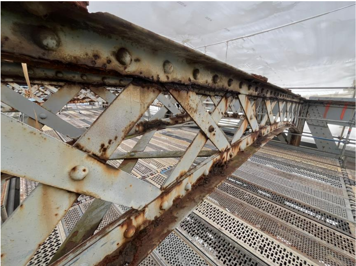
Le degré d'usure constaté sur les entretoises était tellement élevé que décision a été prise de les remplacer