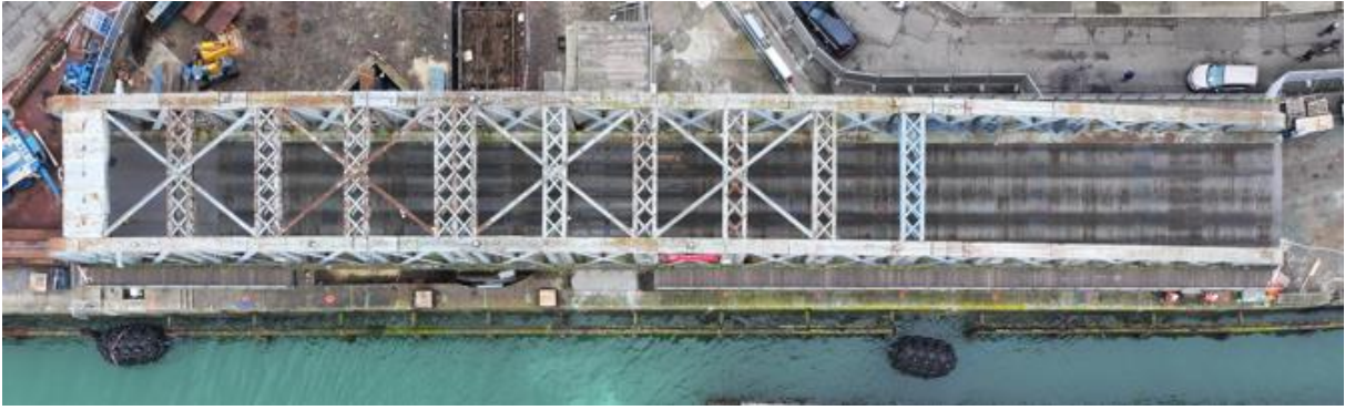
Les entretoises sont les « poutres transversales en croisillons » que l'on aperçoit sur la photo ci-dessus