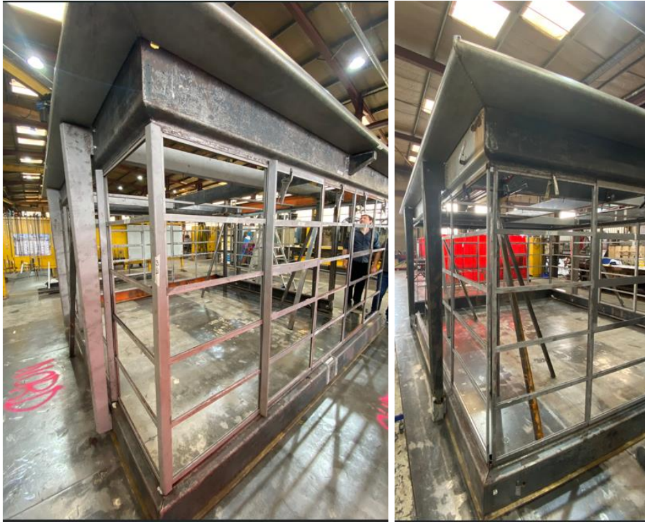
La cabine de manœuvre réassemblée avant peinture