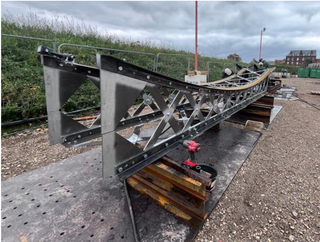
L'une des 10 entretoises en cours de fabrication

Quant au chevêtre (sorte de grosse « caisse » située sous le pont et qui répartit les charges entre le tablier et le pivot), il est en cours de sablage, remise en peinture et remplacement des rivets et autres éléments corrodés.