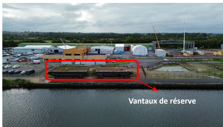
Terminal de Ranville

Parallèlement, la phase 2 des travaux concerne le carénage des portes (ou vantaux d'écluse) actuellement stockées sur le terminal de Ranville. Il s'agit des portes d'origine, construites entre 1961 et 1963, puis carénées pour la dernière fois en 1998. Pour information la surface à traiter sur les deux portes avoisine les 5 400m 2 à nettoyer, sabler puis peindre. Des travaux de chaudronnerie sont également prévus. Les travaux se dérouleront de janvier à début juin. Ce chantier sera mené par l'entreprise Lassarat (agence du Havre).