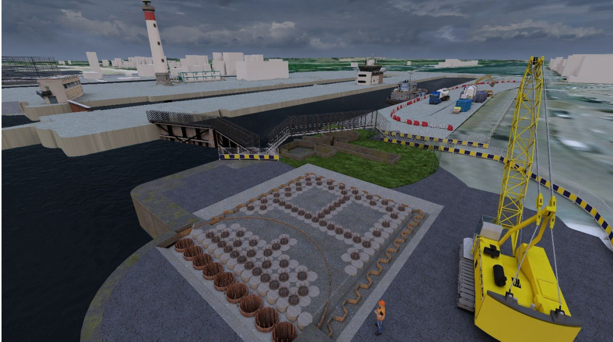
Projection Dalle de transfert

Puis va être construit un ensemble de pieux en béton et métalliques supportant une dalle d'1.5 mètre d'épaisseur dont la fonction sera de répartir tous les efforts transmis par la porte de l'écluse au génie civil notamment pendant les ouvertures de sas (cf. schéma ci-dessous)